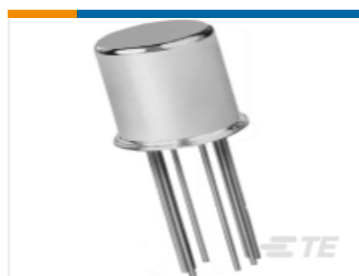
TE 产品编号1617164-7 JMACT-5XL = M28776/1-025L