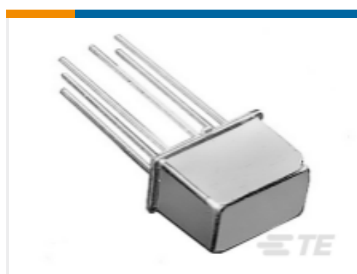
TE 产品编号1617147-5 JMGAP-26P = M39016/17-030P