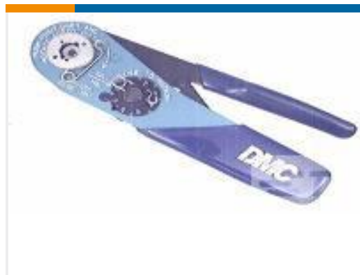
TE 产品编号 601966-1 CRIMPING TOOL M22520/2-01