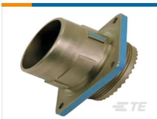
TE 产品编号 YDIV46E11-05SCC009 PLUG ASSY