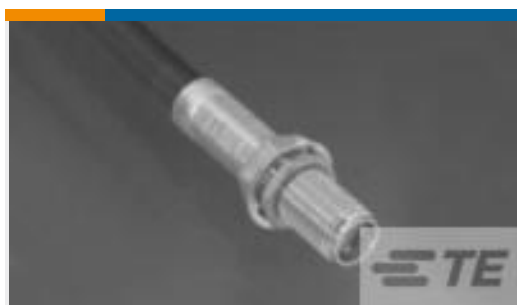
TE 产品编号 1051994-1 2034 8026 92