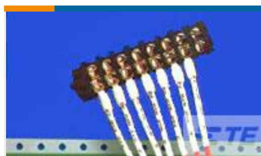
TE 产品编号544030-000 HT-SCE-1K-1-2.0-0