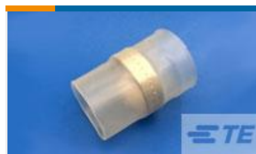
TE 产品编号160887-000 D-106-6025