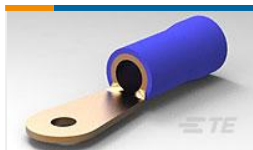
TE 产品编号52042 TERMINAL, R PG 6 8