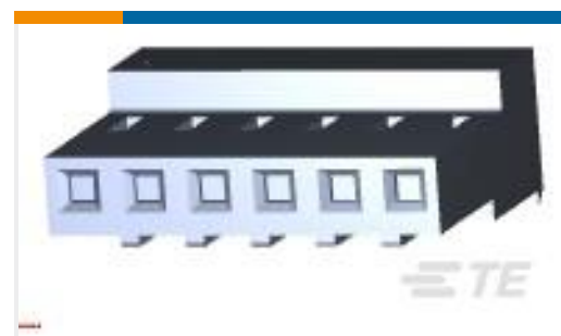
TE 产品编号3-640431-6 06P MTA156 CONN ASSY 18AWG ORA