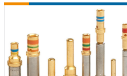
TE 产品编号2560-215-1631L CONT PIN