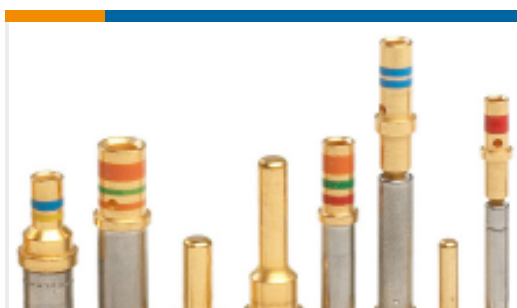
TE 产品编号38941-12L CONT PIN