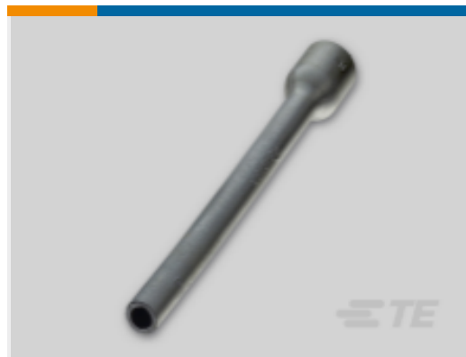
TE 产品编号588042-000 202F263-51-22/86-0