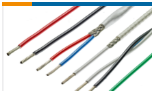
TE 产品编号670713-000 44A0141-16-MST4CS2275