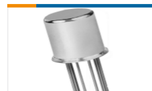
TE 产品编号1617164-7 JMACT-5XL = M28776/1-025L