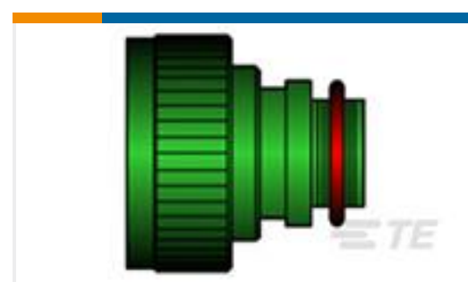
TE 产品编号661269-000 TXR21AB00-1605AI