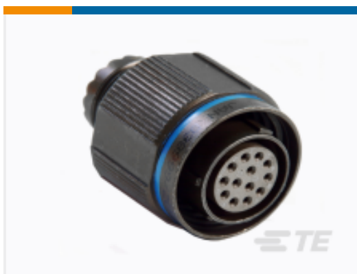
TE 产品编号 YACT26JB02PNV00100 STRAIGHT PLUG