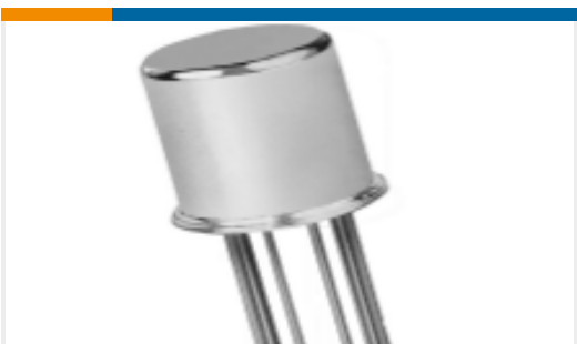
TE 产品编号1617164-7 JMACT-5XL = M28776/1-025L