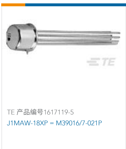
TE 产品编号1617119-5 J1MAW-18XP = M39016/7-021P