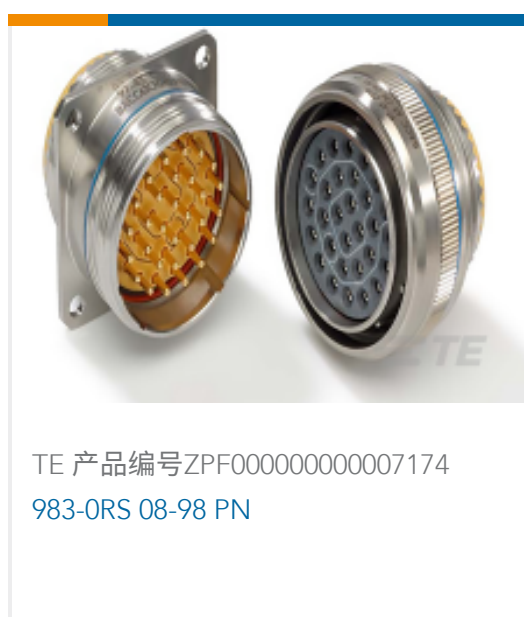
TE 产品编号ZPF000000000007174 983-ORS 08-98 PN