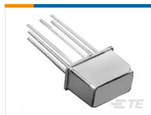
TE 产品编号1617147-5 JMGAP-26P = M39016/17-030P