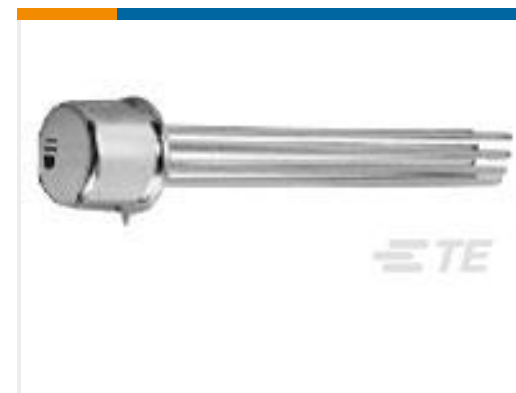
TE 产品编号1617119-5 J1MAW-18XP = M39016/7-021P