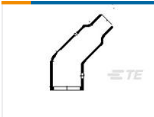
TE 产品编号642427-000 242A312-12-03-0