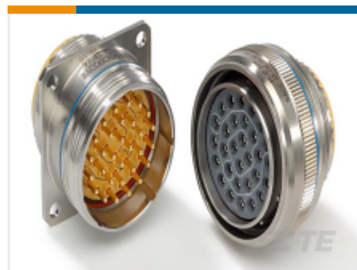
TE 产品编号ZPF000000000007174 983-ORS 08-98 PN