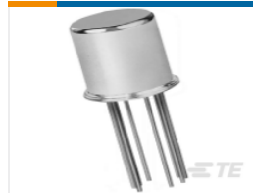
TE 产品编号1617164-7 JMACT-5XL = M28776/1-025L