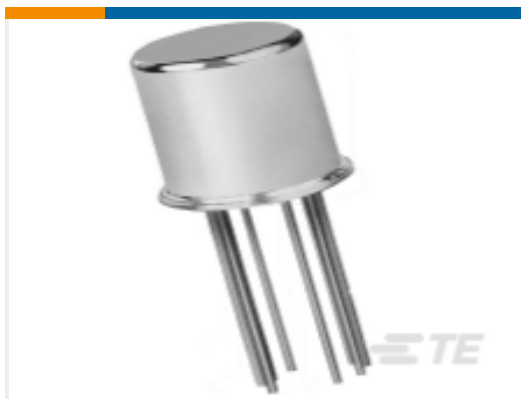
TE 产品编号1617164-7 JMACT-5XL = M28776/1-025L