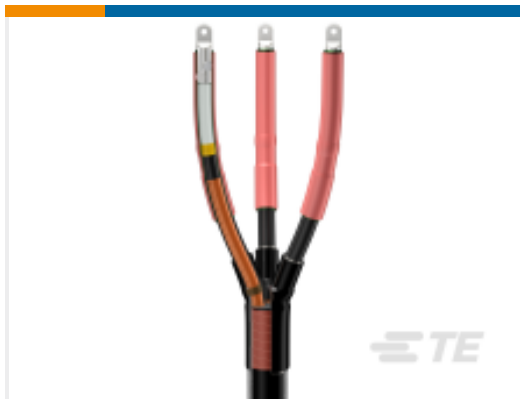
TE 产品编号C38266-064 POLT-12E/3XIH4