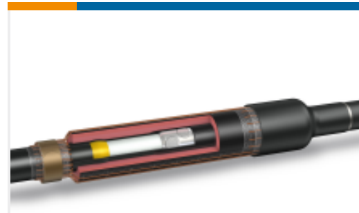
TE 产品编号A49592-070 POLJ-12/1X25-70