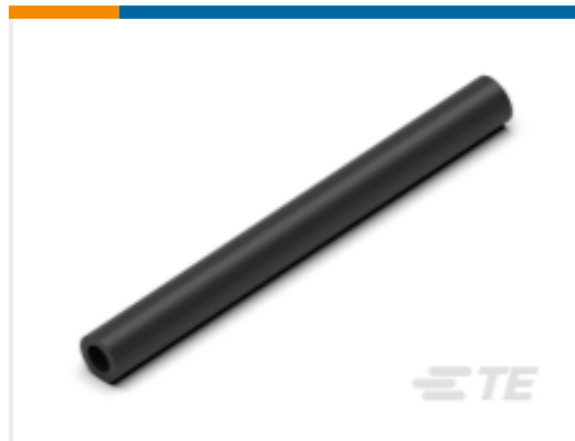
TE 产品编号E86580-000 EN-CGPT-6/2-0-SP