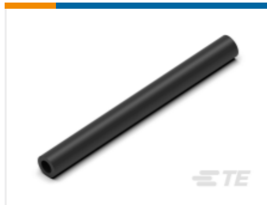
TE 产品编号E01829-000 EN-DCPT-26/13-45-SP