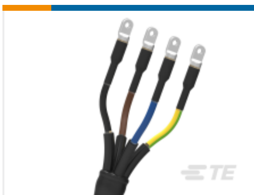
TE 产品编号620097-000 EPKT-0063-L12