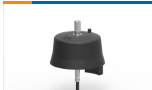
TE 产品编号E03307-000 LVA-280B-AL