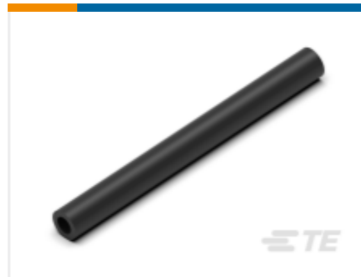
TE 产品编号C62205-000 EN-DCPT-38/19-45-SP