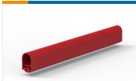
TE 产品编号CM1883-000 MVLC-38-A/241-C(50)