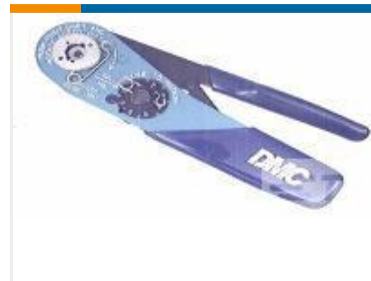
TE 产品编号 601966-1 CRIMPING TOOL M22520/2-01