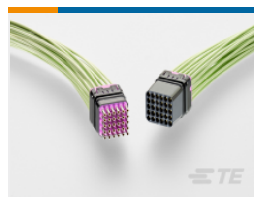
TE 产品编号 ZPF000000000203397 DMC-MR 30-23 PB