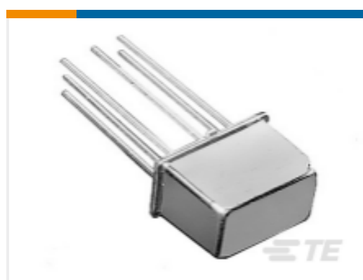
TE 产品编号1617147-5 JMGAP-26P = M39016/17-030P