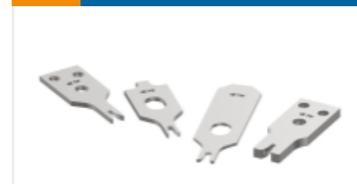
CRIMPER REPRESENTATION ONLY TE 产品编号1803167-5 CRIMPER, INSULATION F SPECIAL