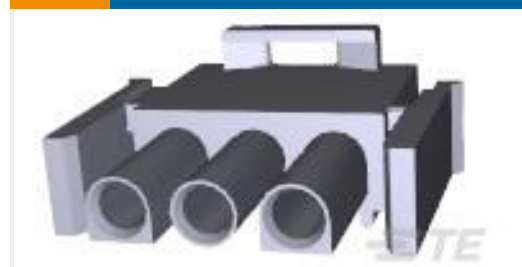
TE 产品编号1-480700-1 03P UMNL PLUG HSG BRN