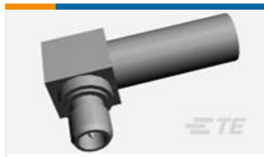
TE 产品编号1408149-1 MMCX RT ANGLE PLUG - CRIMP ATT