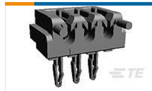
TE 产品编号2-173983-6 AMP CT MT AMP-IN HDR-H YEL 6P