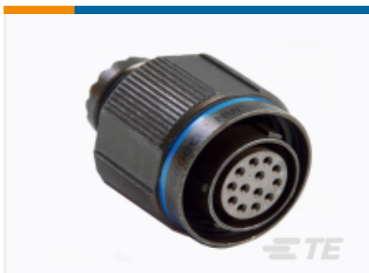
TE 产品编号 YDTS26G23-21SNC001 PLUG ASSY