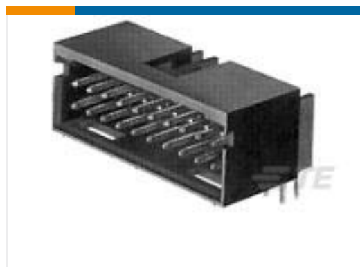
TE 产品编号 5-87579-3 12 MODII HDR DRRA SHRD LF