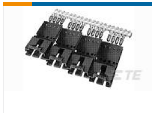
TE 产品编号 103948-2 5X3 MTE SHRD PIN SR LATCH .100