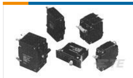
TE 产品编号 8-1393254-9 W92-X113-50=M6/M7/M9/W6/W7