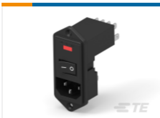
TE 产品编号 3-6609959-9 PMOSSD000=C5253