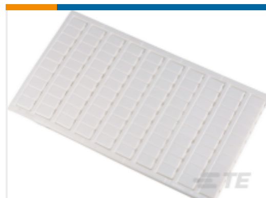
TE 产品编号 1SNK160061R0000 MC812PA 51->60 (x10) Horizontal