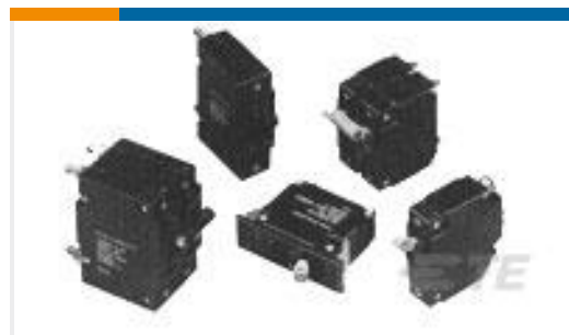
TE 产品编号 8-1393254-3 W92-X112-50=M6/M7/M9/W6/W7