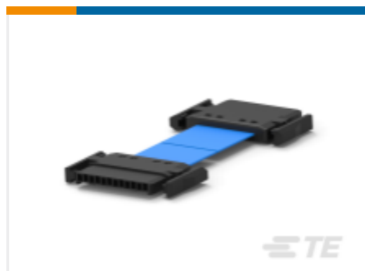
TE 产品编号 6-765269-8 SEP. PLUG TO PLUG - 43.5 IN