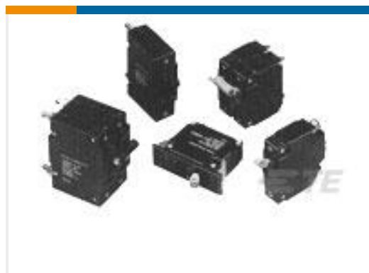
TE 产品编号 1-1393254-6 W91-X1110-10=M6/M7/M9/W6/W7