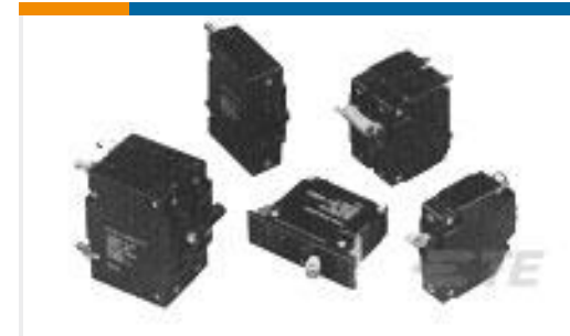
TE 产品编号 6-1393254-4 W92-X1110-30=M6/M7/M9/W6/W7