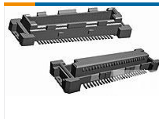
TE 产品编号1-5353727-0 .6FHP08H,280,B,GIG,08/Sn,ST,NSYes