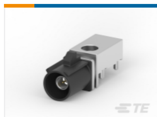
TE 产品编号5-2287906-1 FAKRA, 1 POS, EDGE MOUNT, 12 OCLOCK ASSY