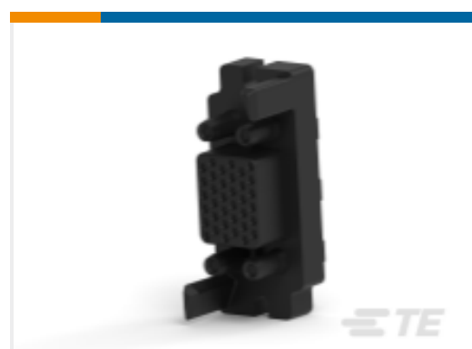
TE 产品编号2212082-1 CONNECTOR,SOCKET,SQUARE DRAWER