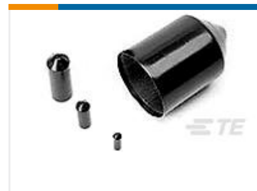
TE 产品编号A54080-000 101A073-25/86-0