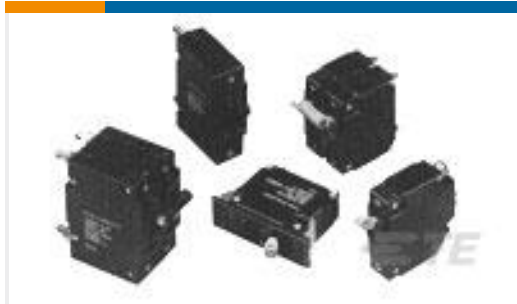
TE 产品编号 7-1393254-8 W92-X112-30V=M6/M7/M9/W6/W7