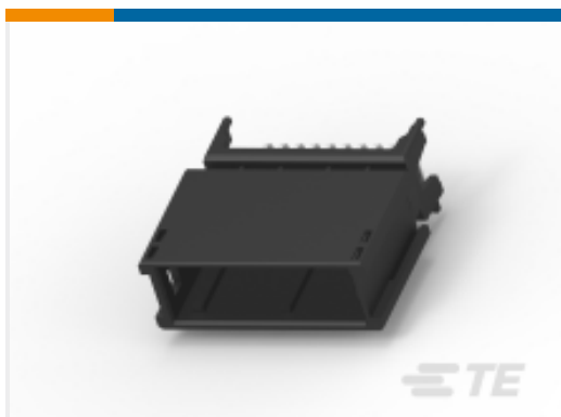
TE 产品编号2208165-2 20POS,NANO MQS,HEADER ASSY, CODB