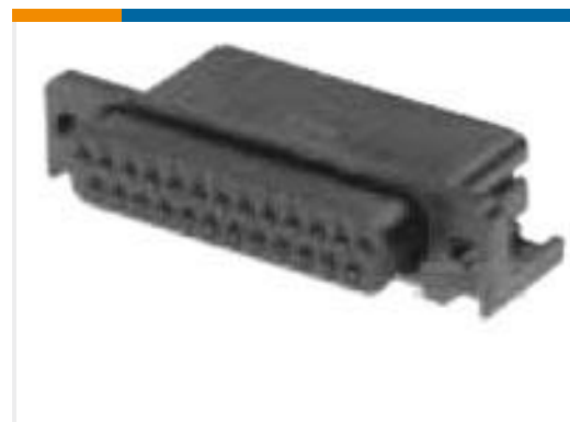
TE 产品编号5748989-1 AMP III RCPT 25P RA 590 FFSCRLK /BDLK