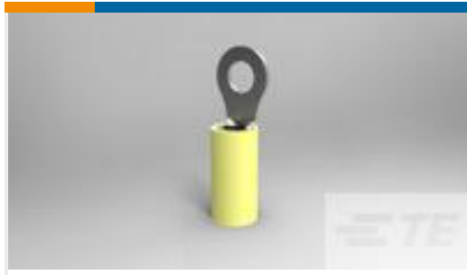
TE 产品编号 2-36161-3 TERMINAL,PIDG R IR 12 10