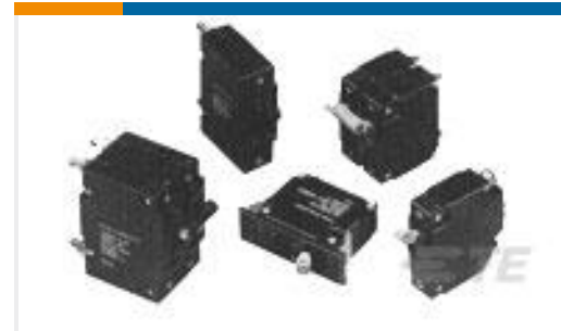
TE 产品编号 7-1393254-7 W92-X112-30=M6/M7/M9/W6/W7