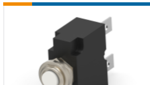
TE 产品编号1423675-6 W57-XB7A4A10-8=CKTBKR,THERM,PB