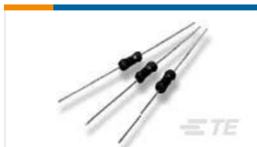
TE 产品编号3-1879354-2 RR03 5% 6R2 AMMO