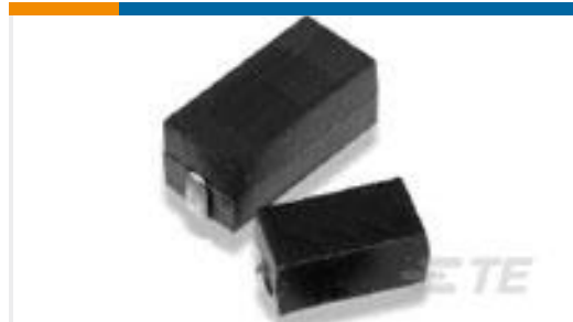
TE 产品编号 1879234-7 SMF5 910R 5%