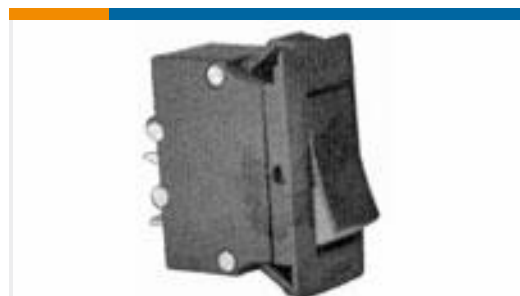
TE 产品编号3-1423673-9 W51-A152A1-5=CKTBKR,THERM,ROC