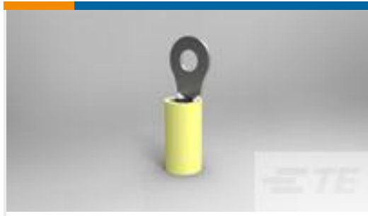
TE 产品编号 2-320568-2 TERM, RT, PIDG IR, 12, #8