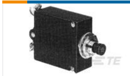
TE 产品编号 6-1393246-5 W23-X1A1G-10=W23/W31