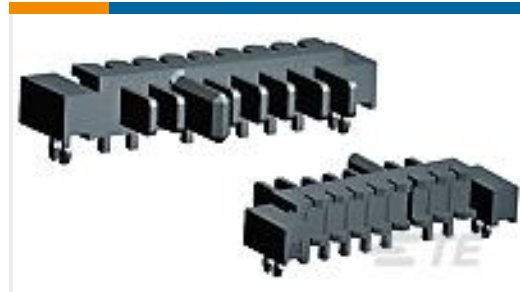
TE 产品编号 1827654-2 2mm pitch Battery Plug Assy. 7P. H=4.0