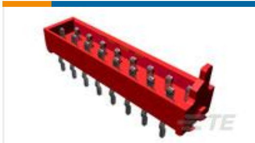
TE 产品编号7-215464-4 04P.MICRO-MATCH MOB