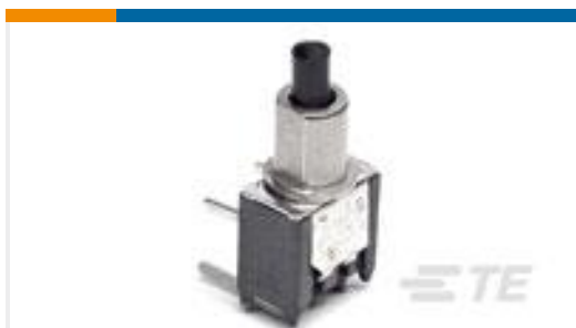
TE 产品编号1825095-2 TP11CGPC204