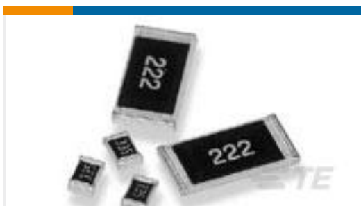
TE 产品编号1623112-1 CRG0805 1% 13K