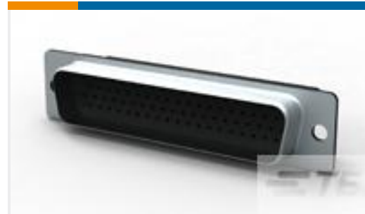
TE 产品编号 1658674-1 HDP-22,PLUG,SIZE 5,78 POSN