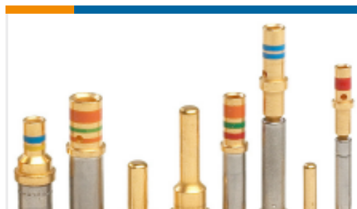
TE 产品编号 2562-201-2031L CONT SOC ASSY