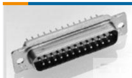
TE 产品编号 1757820-2 AMPLIMITE,ASY,RCPT,STD,109,ZN,2