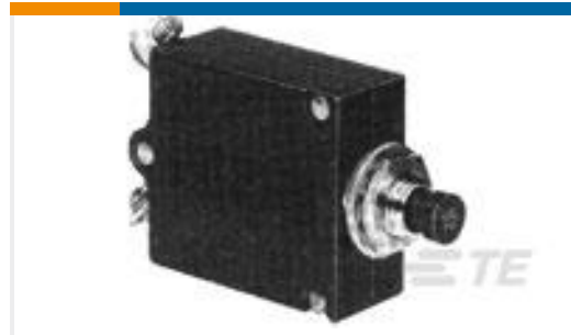
TE 产品编号 7-1393246-7 W23-X1A1G-7.50=W23/W31