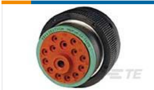
TE 产品编号 HDP26-24-14PN PLG, 14P, BLK, N, 4/12/16, P