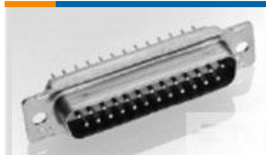
TE 产品编号 205161-1 AMPLIMITE,ASY,RCPT,STD,109,1