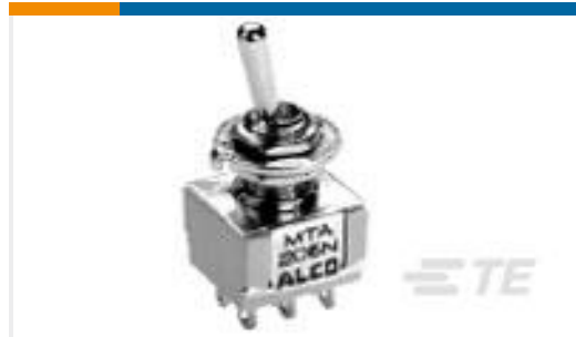
TE 产品编号 2-1437558-0 MTA206N=(MSTA) SW TOG DPDT