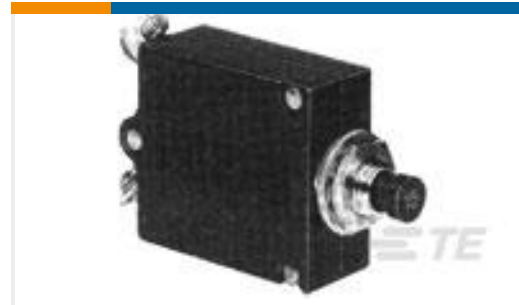
TE 产品编号 7-1393246-3 W23-X1A1G-4=W23/W31