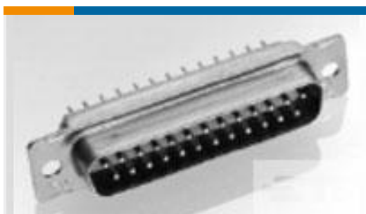
TE 产品编号 1757820-9 AMPLIMITE,ASY,RCPT,STD,109,ZN,4, CT