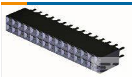
TE 产品编号1-534998-5 30 MODIV VRT DR CE 100/125