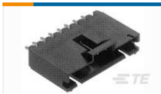
TE 产品编号103735-9 10 MTE HDR SRST LATCH.100CL