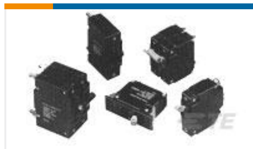
TE 产品编号 7-1393254-6 W92-X112-3=M6/M7/M9/W6/W7