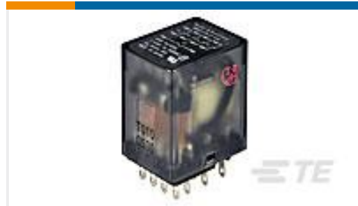
TE 产品编号2-1393122-8 KHAU-17A12-120=KH