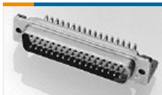
TE 产品编号1218434-4 R/A RCP ASSY 37 POS SER 109