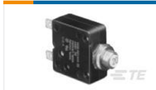
TE 产品编号2-1393249-0 W58-XB1A4A-6=W58