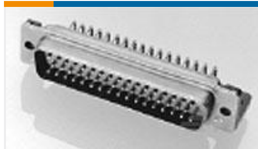
TE 产品编号1218441-1 R/A PLG ASSY 9 POS SER 109