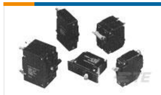
TE 产品编号 8-1393254-4 W92-X112-7=M6/M7/M9/W6/W7