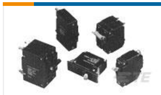
TE 产品编号 9-1393254-6 W93-X1110-20=M6/M7/M9/W6/W7