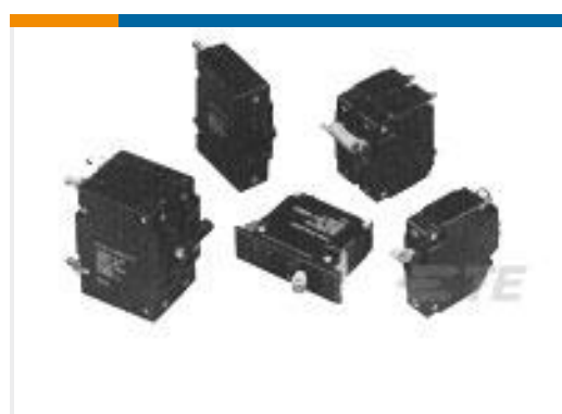
TE 产品编号 1-1393255-3 W93-X112-50=M6/M7/M9/W6/W7