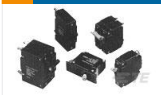
TE 产品编号 1393255-5 W93-X112-20V=M6/M7/M9/W6/W7