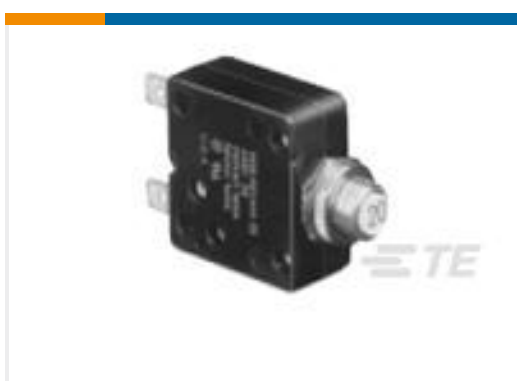
TE 产品编号 1-1393249-4 W58-XB1A4A-3=W58