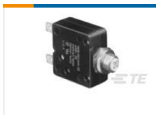
TE 产品编号 1393249-8 W58-XB1A4A-12=W58