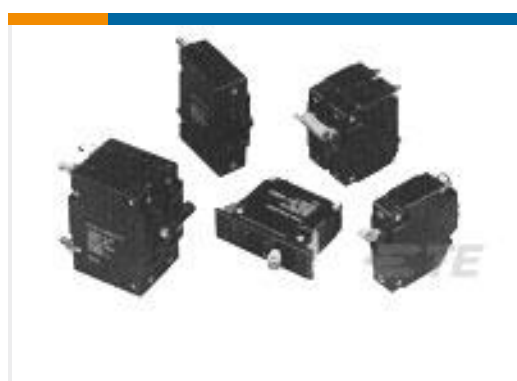
TE 产品编号 1393255-8 W93-X112-30=M6/M7/M9/W6/W7