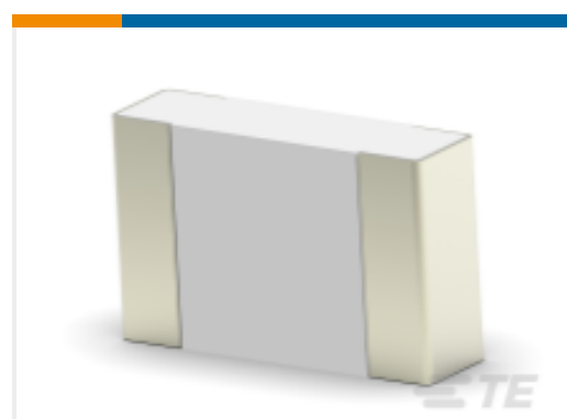
TE 产品编号 1-2176244-3 CRGS0805 5% 10R