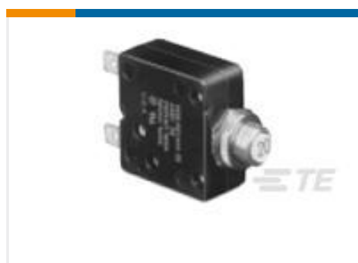
TE 产品编号 1393249-5 W58-XB1A4A-1=W58