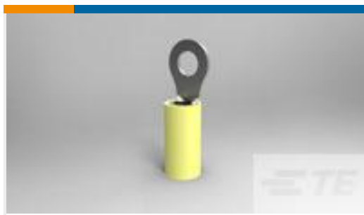
TE 产品编号 2-36161-3 TERMINAL,PIDG R IR 12 10