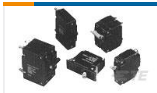
TE 产品编号 1393255-2 W93-X112-15=M6/M7/M9/W6/W7