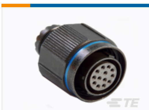
TE 产品编号DTS26W17-06SN PLUG ASSY