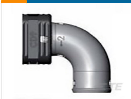
TE 产品编号ZPF000000000102764 787-8055-30M