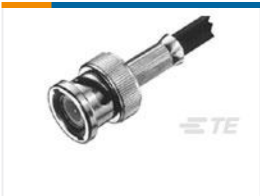
TE 产品编号2-5221128-3 PLUG,COMMERCIAL BNC