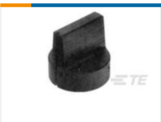
TE 产品编号6-1437621-7 KCB900B1/4=KNOB BAR BLACK 1/4