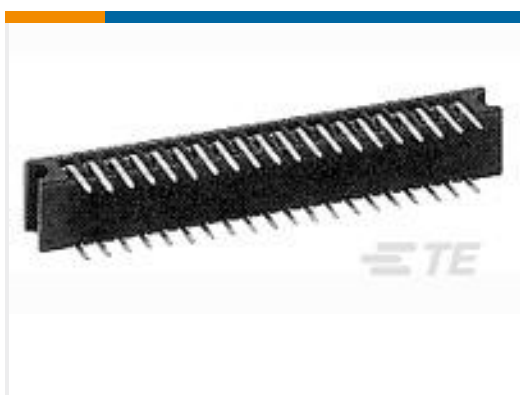
TE 产品编号6-532955-2 80 MODII 2PC CE RCPT ASSY, RoHS