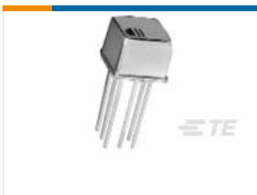
TE 产品编号2-1617146-7 JMGACDD-26L = M39016/19-036L