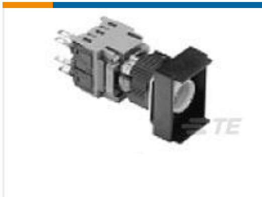
TE 产品编号3-1437569-5 164TL22=RECT MOM ILLUM PB 2NO&