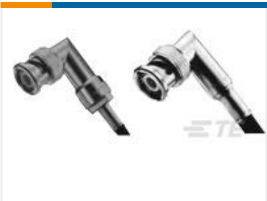
TE 产品编号225974-1 PLUG, RT ANGLE, DUAL CRIMP BNC