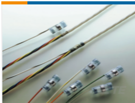
TE 产品编号 367417N001 S02-18-R-90CS1092