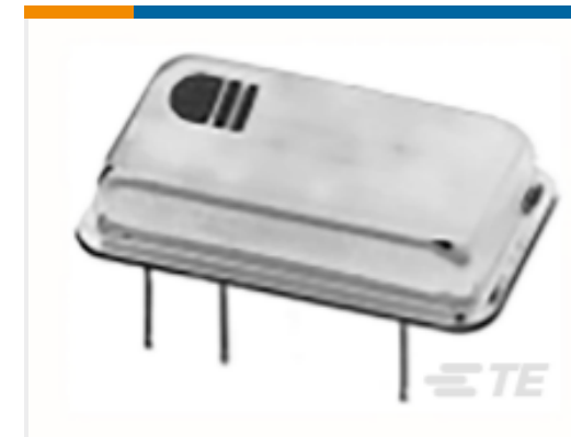
TE 产品编号 3-1618400-8 DS11-1005T=SOLID STATE RELAY