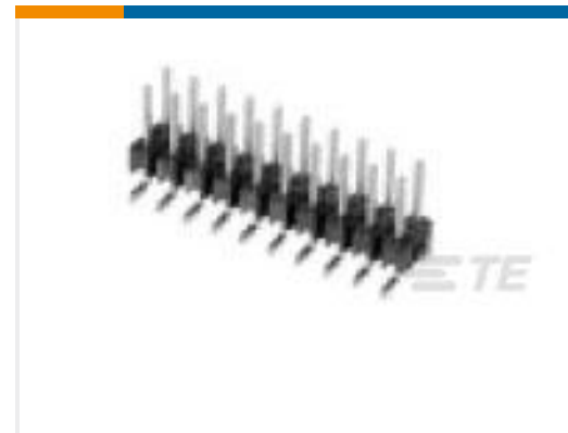
TE 产品编号 147279-1 06 MODII HDR DR SFMT B/A T&R