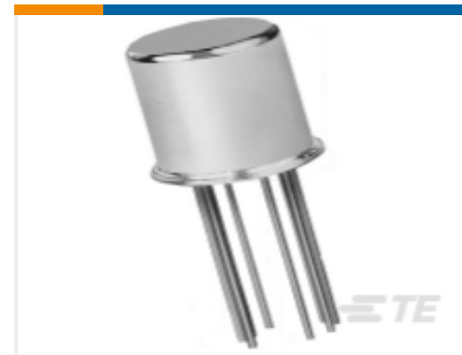
TE 产品编号 1617120-4 J1MSW-26XL = M39016/10-023L