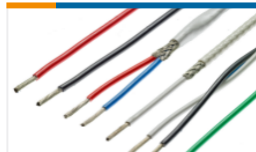
TE 产品编号990495-000 44AM1821-16-9/96-9CS2275