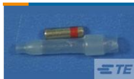
TE 产品编号664681-000 D-609-07CS2603