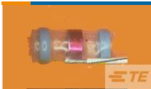
TE 产品编号942147N002 S02-10-R-5CS816