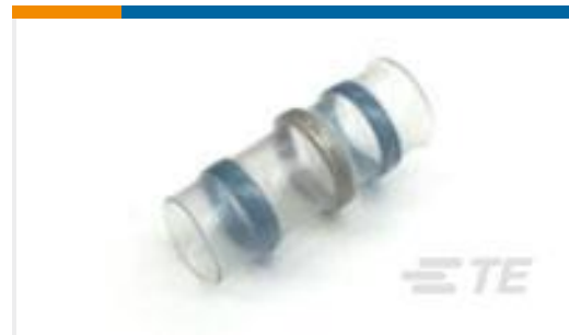
TE 产品编号257509N002 S02-10-R-6CS816