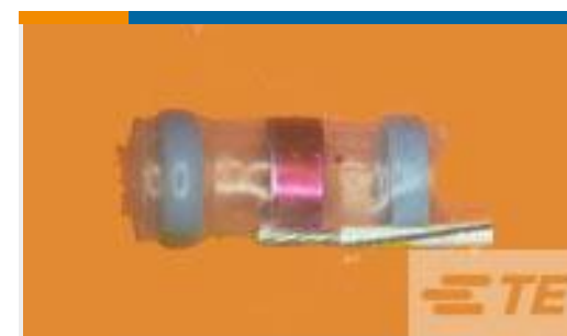
TE 产品编号5803000003 S02-10-R-92CS927