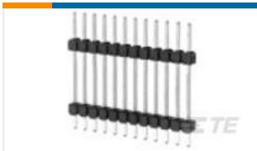
TE 产品编号 1-146458-9 19 MODII HDR SRST UNSHRD STKG