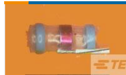
TE 产品编号 932425N002 S02-08-R-6CS816