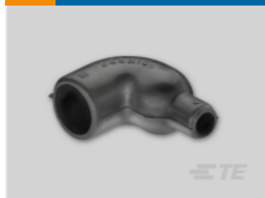
TE 产品编号806823-000 球形热缩护套：有嘴，直角