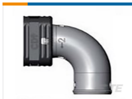
TE 产品编号ZPF000000000102764 787-8055-30M