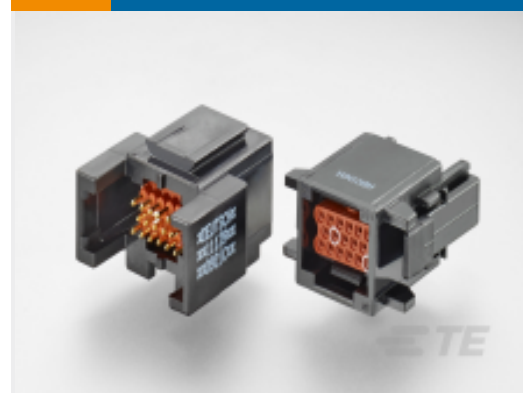
TE 产品编号ABC03N-20P IN-LINE RECIP