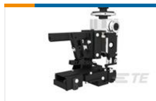
TE 产品编号2266002-1 OCEAN-2.0-APPLICATOR-S-062F132O