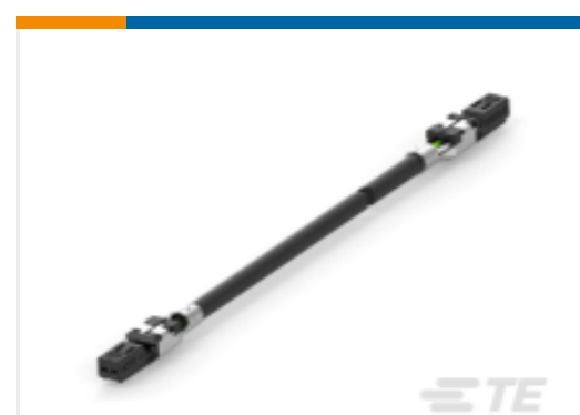
TE 产品编号2362765-6 MATENET,CABLE ASSY,100 MBPS UTP