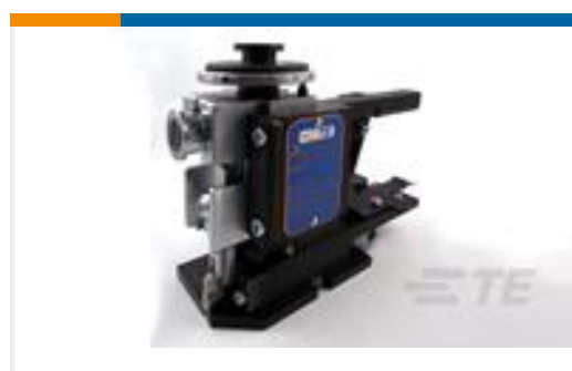
TE 产品编号2150417-1 OC-AT-E-FM-090F140F-040-0835