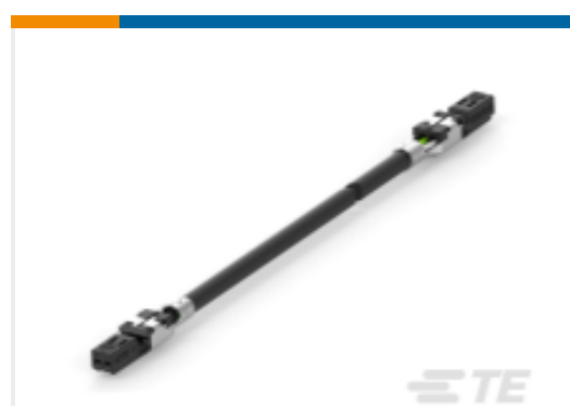
TE 产品编号2362765-3 MATENET,CABLE ASSY,100 MBPS UTP