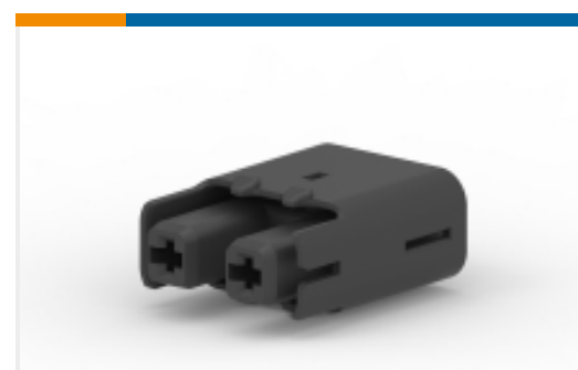
TE 产品编号2103387-2 INNER HSG, PLUG, HVA280-2PHM, PASS T