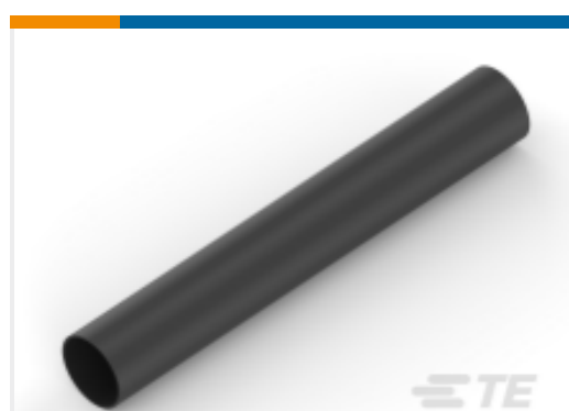
TE 产品编号NB07566001 HTAT-24/6-0-110MM