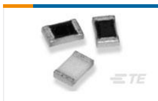
TE 产品编号6-1623707-5 TRIMMABLE 1206 0/-10% 68K