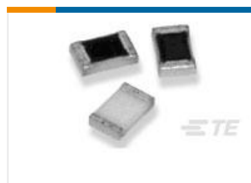
TE 产品编号1623707-7 TRIMMABLE 0805 0/-10% 910K