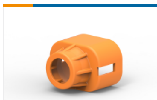
TE 产品编号2103168-3 CABLE SEAL RETAINER, SIZE 2, OR, HVA280