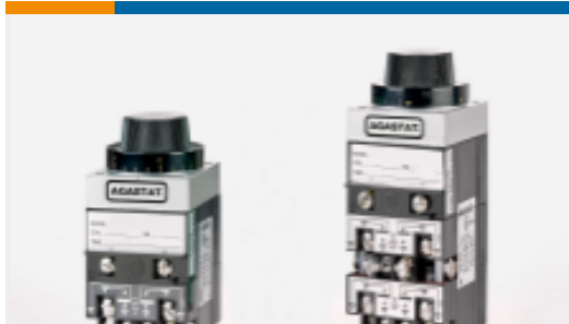
TE 产品编号4-1472969-3 7022QH=RLY,STD,OFF,2P,12VDC, 30MIN