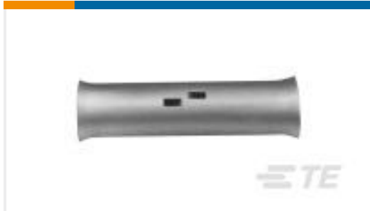
TE 产品编号53089 SPLICE,AMPPOWER BUTT 500MCM