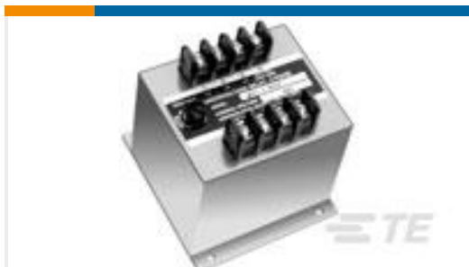
TE 产品编号6-1618112-0 WUV-3-120=WILMAR UNDERVOLTAGE