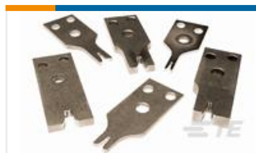
TE 产品编号2-456406-5 WIRE CRIMPER .090