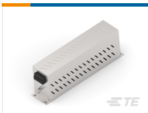
TE 产品编号2-1609998-3 KEV 42A 2S SP WYE BS 440VAC