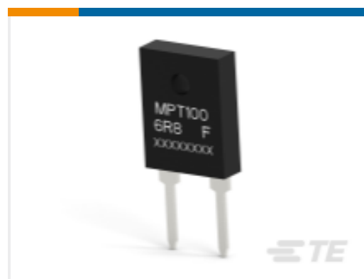
TE 产品编号2176429-5 MPT100 R47 5%