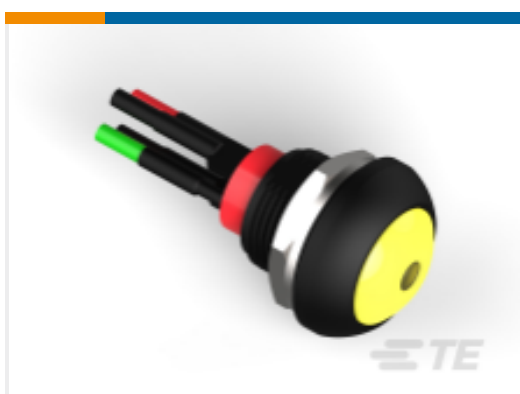
TE 产品编号1-2329389-1 PB OFF/ON FC YLW M1 TERM WHI LED IP68 50