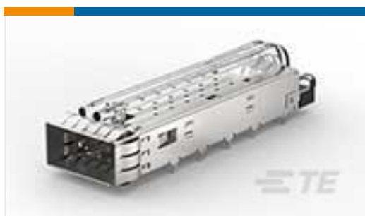
TE 产品编号2170773-1 CAGE ASSY, QSFP28 1X1, SPRING, LP