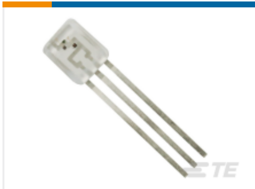
TE 产品编号11032254-00 EMITTER 660/940NM 1 2