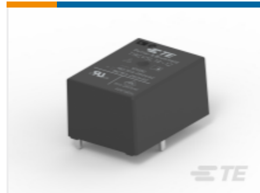
TE 产品编号1558662-4 T9GV2L14-15