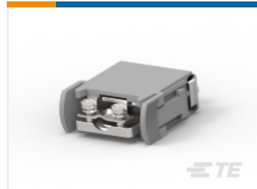
TE 产品编号T2111092201-007 HMN-009-F