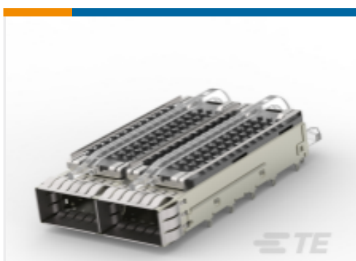
TE 产品编号2170808-1 QSFP28, 1X2, CAGE ASSY, SPRING, HS, LP