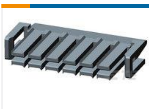
TE 产品编号2-1969541-8 RETAINER, TPA, DUAL ROW, EP2.5