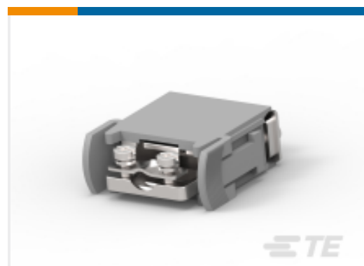
TE 产品编号T2111092201-007 HMN-009-F