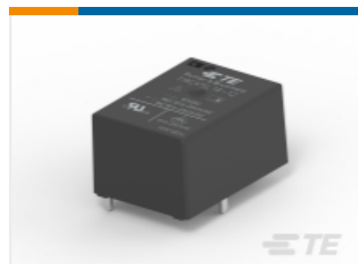
TE 产品编号1558662-4 T9GV2L14-15