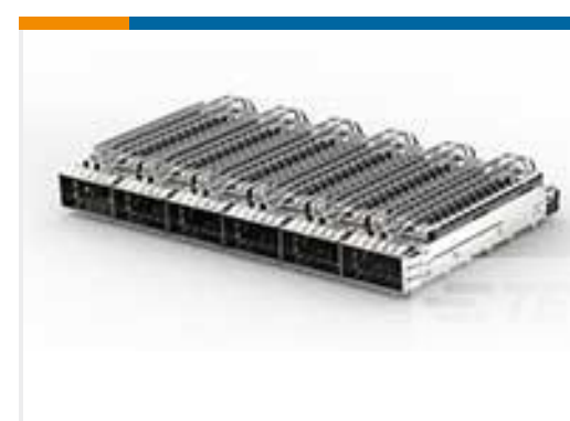
TE 产品编号2-2170708-1 CAGE ASSY, 1X6, QSFP28, SPRING, HS, LP