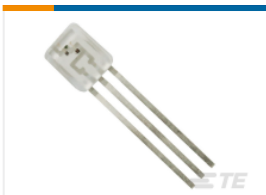
TE 产品编号11032254-00 EMITTER 660/940NM 1 2