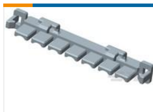
TE 产品编号1-1969609-2 12P VAL-U-LOK TPA 26-22 AWG