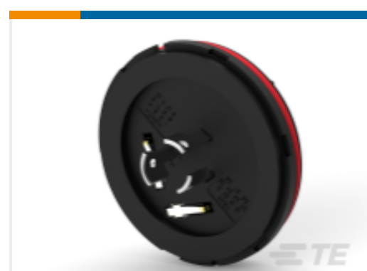
TE 产品编号1-2336396-1 ASSEMBLY, LIGHT CONTROLLER BASE, W/VENT