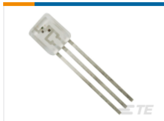
TE 产品编号11032254-00 EMITTER 660/940NM 1 2