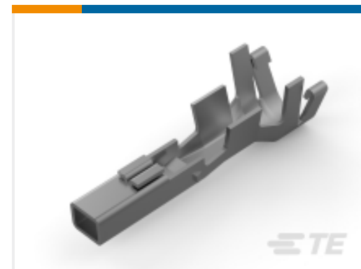
TE 产品编号177915-9 POWER DBL LOCK REC CONT