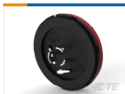
TE 产品编号1-2336396-1 ASSEMBLY, LIGHT CONTROLLER BASE, W/VENT