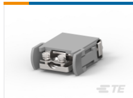
TE 产品编号T2111092201-007 HMN-009-F