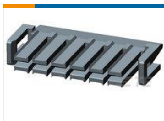
TE 产品编号2-1969541-8 RETAINER, TPA, DUAL ROW, EP2.5