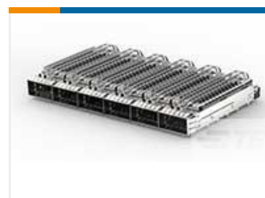
TE 产品编号2-2170708-1 CAGE ASSY, 1X6, QSFP28, SPRING, HS, LP