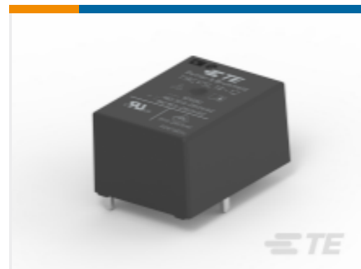
TE 产品编号1558662-4 T9GV2L14-15