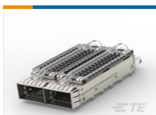
TE 产品编号2170808-1 QSFP28, 1X2, CAGE ASSY, SPRING, HS, LP