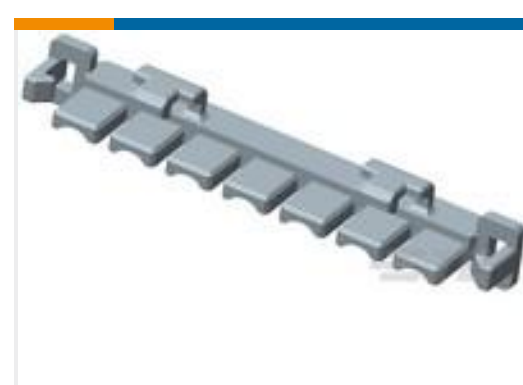
TE 产品编号1-1969609-2 12P VAL-U-LOK TPA 26-22 AWG