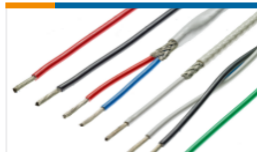
TE 产品编号1130813001 100G0111-2.50-45