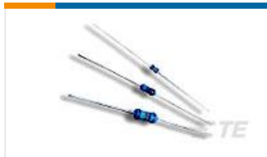
TE 产品编号1622389-1 LR1 1% 22K