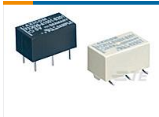
TE 产品编号1393774-1 V23026A1001B201