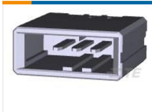
TE 产品编号1-178313-2 DYNAMIC D3100 HDR V 3P ASSY