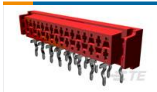
TE 产品编号1-338070-4 MICRO-MATCH FEM.SE