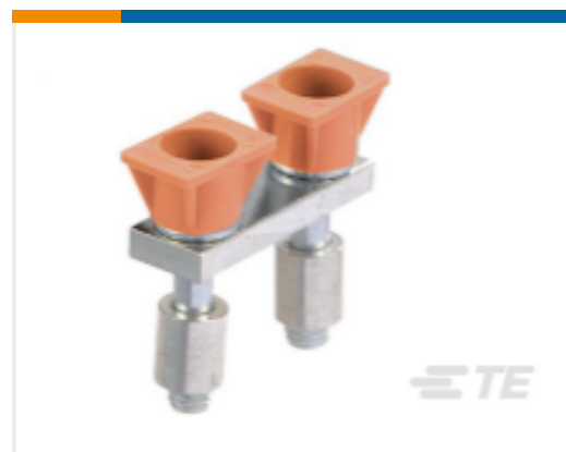
TE 产品编号1SNK916304R0000 JB16-4