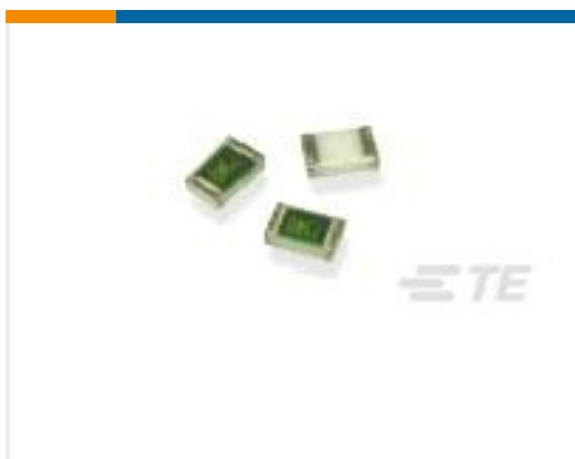
TE 产品编号1879126-5 RN 0402 115R 0.1% 10PPM 1K RL