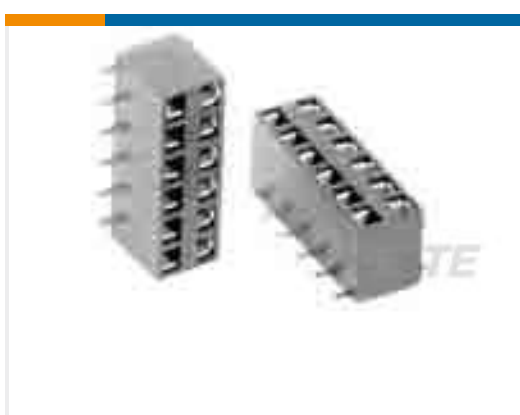
TE 产品编号966645-6 2x6P HV100 REC. CON, SMD, GOLD, TUBE PACK