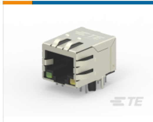
TE 产品编号1-2301994-2 RJ45 JACK INT.MAG. 1GB LED 1X1