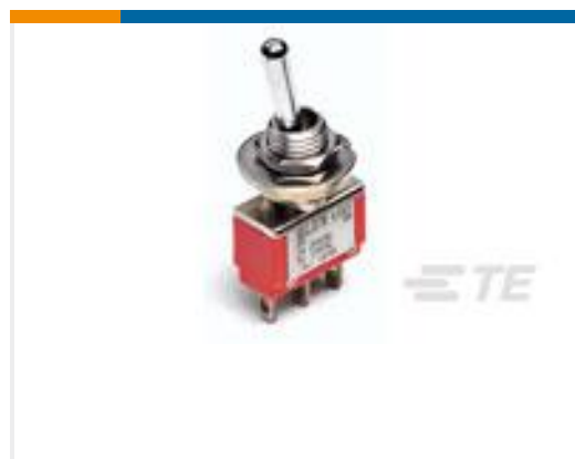
TE 产品编号1825136-6 A101KD9AQ04