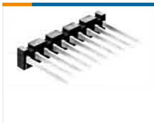
TE 产品编号1-826539-5 15P MOD 1 UNSHROUDED HEADER, ST, 0.8 Au