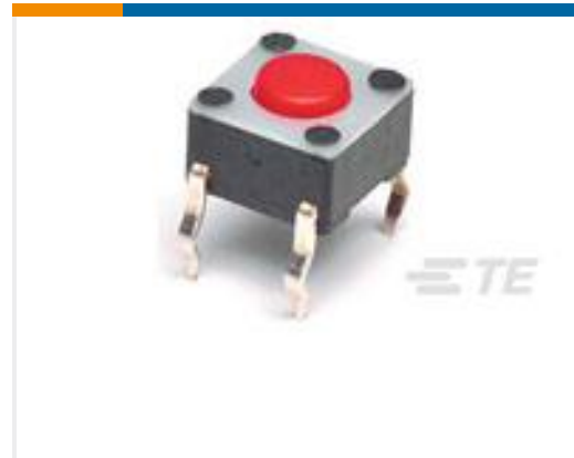
TE 产品编号1825910-2 FSM2JH=6MM TACT SWITCH, HIGH TEMP