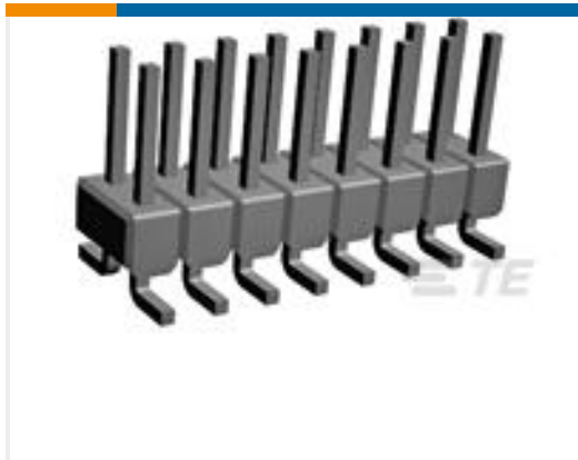
TE 产品编号1241050-8 2x8P MOD II BREAK AWAY HDR,SMD, BLISTER