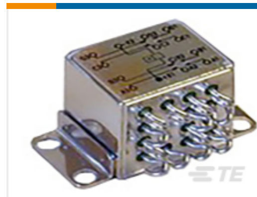
TE 产品编号 1-1617787-0 FCB-405-0520L=M83536/5-020L