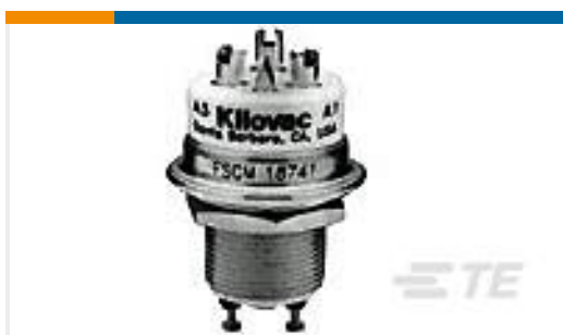
TE 产品编号 1-1618279-4 MHC-3=RELAY, VACUUM, SPDT