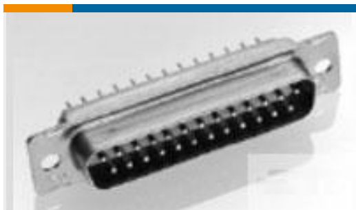
TE 产品编号 1218124-3 25 POS,ASSY,PLUG,LOW PROF,109