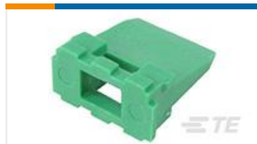
TE 产品编号W6P WEDGE LOCK, 6P, REC, GRN, DT