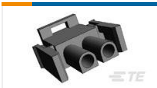
TE 产品编号1-480698-0 02P UMNL PLUG HSG NATL