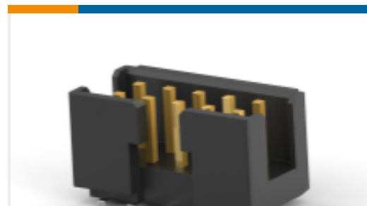
TE 产品编号1-2373376-0 10P,2MM,SHRD HDR,DRVT,SMD,0.1 AU,TB