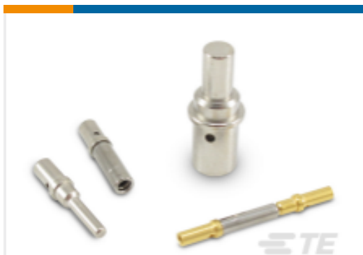
TE 产品编号0462-201-20141 DEUTSCH 实芯端子