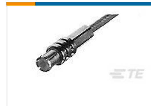
TE 产品编号1060875-2 MCX CABLE PLUG, CRIMP ATTACH