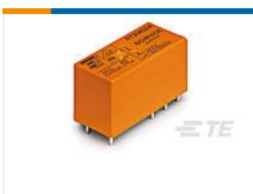
TE 产品编号1-1649329-5 RT424024