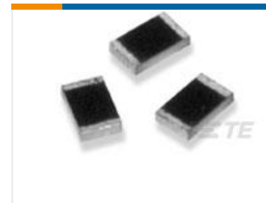
TE 产品编号1-1625868-1 RP 2A 0.25W 301R 0.1% 25PPM 1K RL