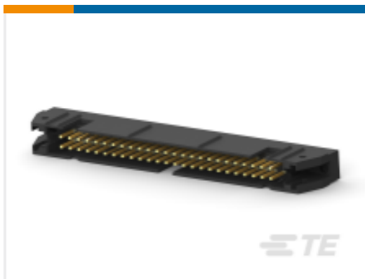
TE 产品编号1-499141-0 AMP 锁门通用插头