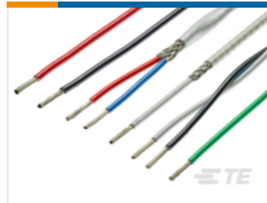
TE 产品编号902667-000 44AM1141-16-MST4-9CS2275