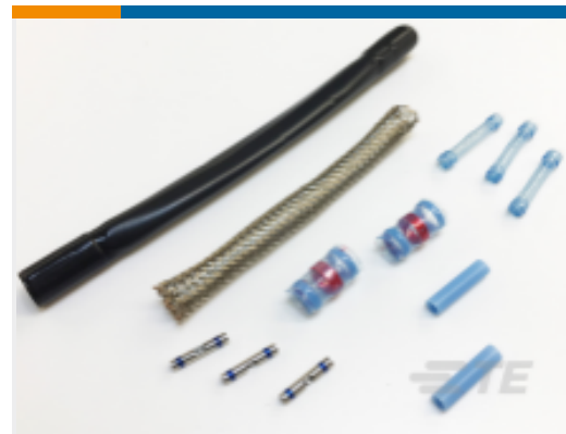
TE 产品编号CW7949-000 D-200-0243-RT