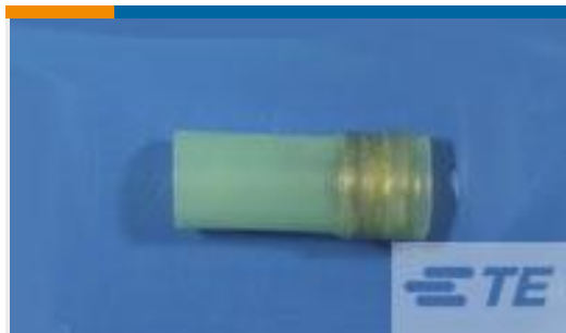
TE 产品编号CV7712-000 D-200-0228-RT