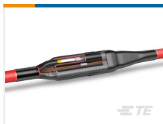
TE 产品编号A76235-000 TRAJ-01/4X150-240/4SB