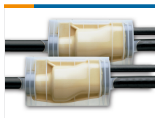
TE 产品编号C57047-000 RAPID-43B-D170