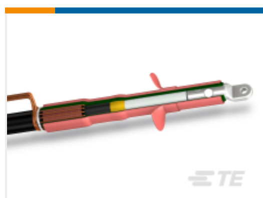
TE 产品编号C82154-013 POLT-12D/1XO