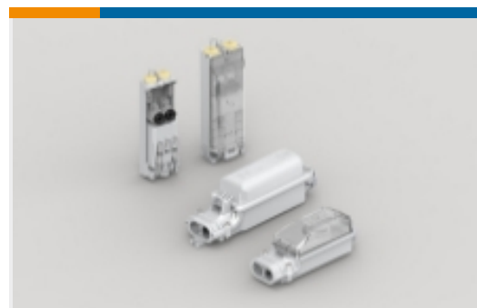
街道照明保险丝盒(201)