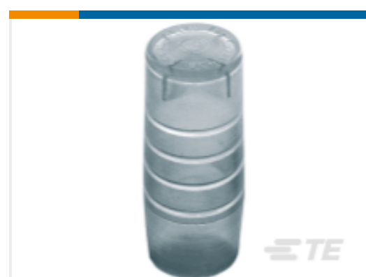
TE 产品编号CN1960-000 GURO-CEC-8/12