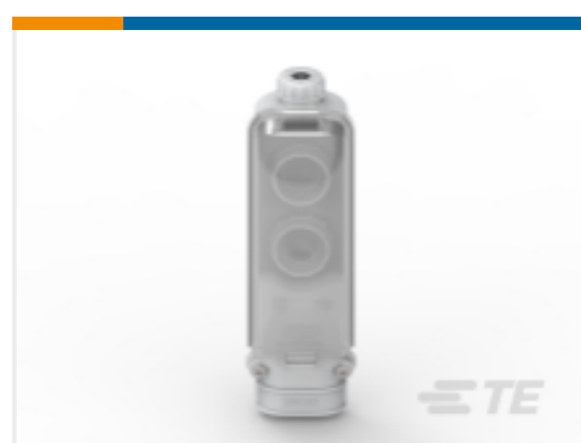
TE 产品编号541838-000 EKM-1272-2D2-4X16