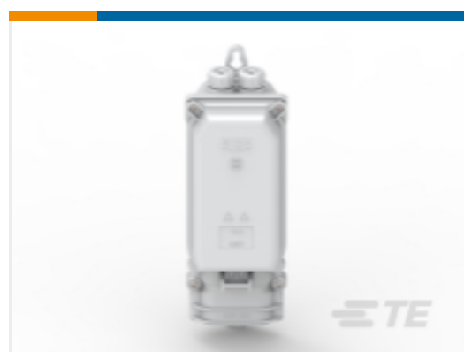
TE 产品编号612804-000 EKM-1281-1D2-5X25-2PG-C2