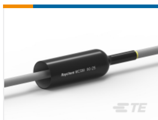
TE 产品编号CU4599-000 WCSM-90/25-700/S(S5)