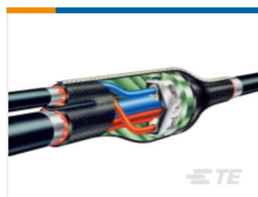
TE 产品编号728079-000 BMHM-1001-4D2