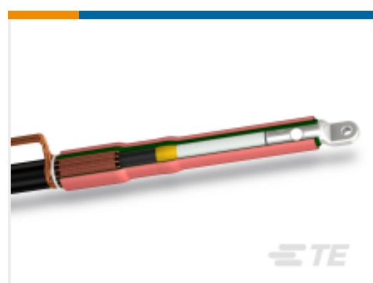
TE 产品编号CF6274-070 POLT-12C/1XI-ML-1-13