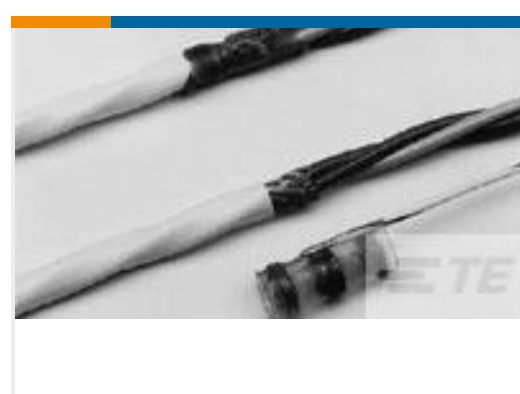
TE 产品编号 C88166-000 S200-1-W1-22-9