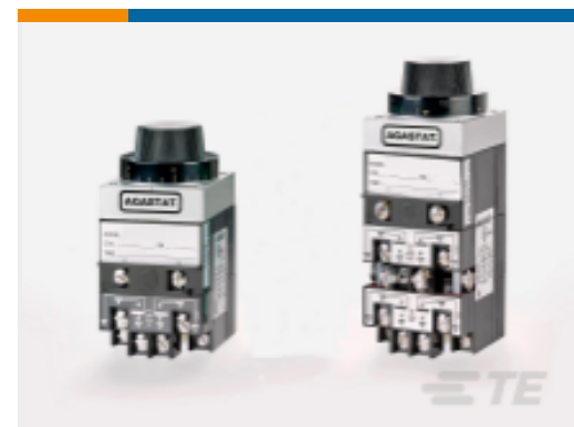
TE 产品编号1755170-1 7022OCIM=RLY,STD,OFF,2P,24V,15S,I, M