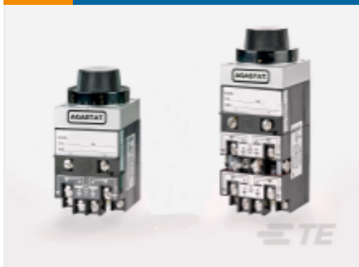
TE 产品编号 1423169-6 E7012PB004=RLY,NUC,ON,2P,125V