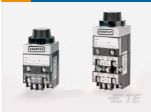
TE 产品编号 1423169-8 E7012PC004=RLY,NUC,ON,2P,125V