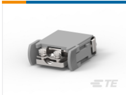
TE 产品编号T2111092201-007 HMN-009-F