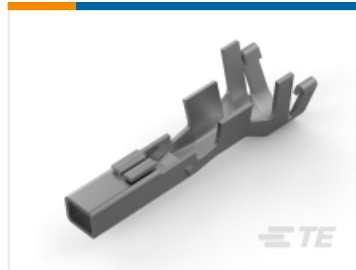
TE 产品编号177915-9 POWER DBL LOCK REC CONT