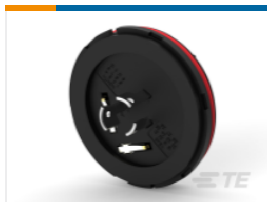
TE 产品编号1-2336396-1 ASSEMBLY, LIGHT CONTROLLER BASE, W/VENT