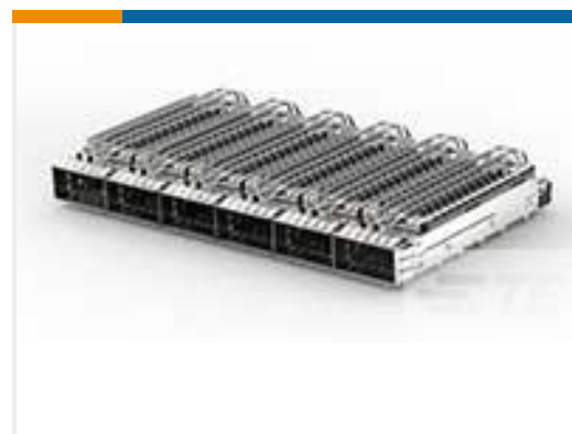
TE 产品编号2-2170708-1 CAGE ASSY, 1X6, QSFP28, SPRING, HS, LP