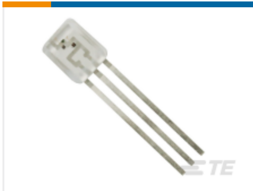
TE 产品编号11032254-00 EMITTER 660/940NM 1 2