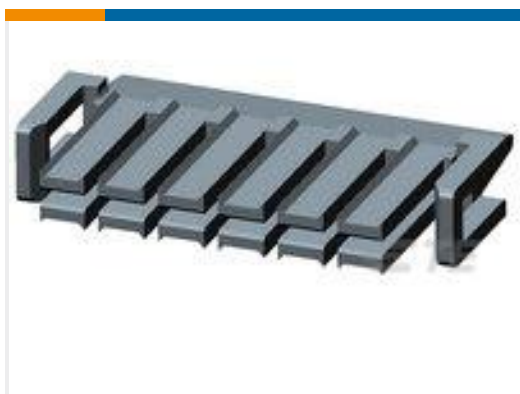
TE 产品编号2-1969541-8 RETAINER, TPA, DUAL ROW, EP2.5