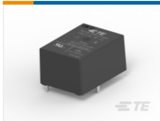
TE 产品编号1558662-4 T9GV2L14-15