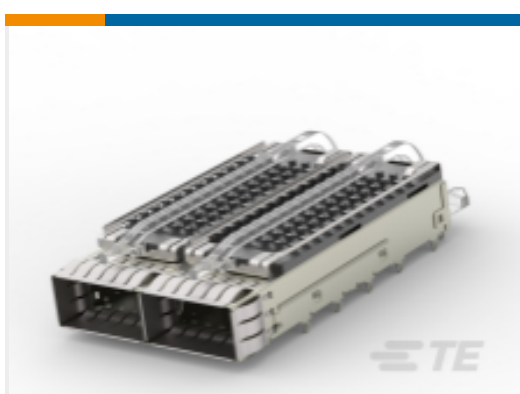
TE 产品编号2170808-1 QSFP28, 1X2, CAGE ASSY, SPRING, HS, LP