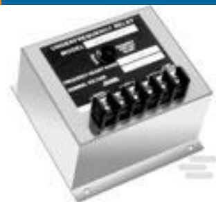
TE 产品编号 1-1618107-0 WOF-23-6070=WILMAR OVERFREQUEN