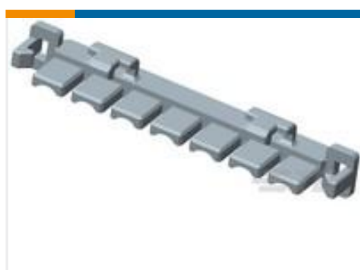
TE 产品编号1-1969609-2 12P VAL-U-LOK TPA 26-22 AWG