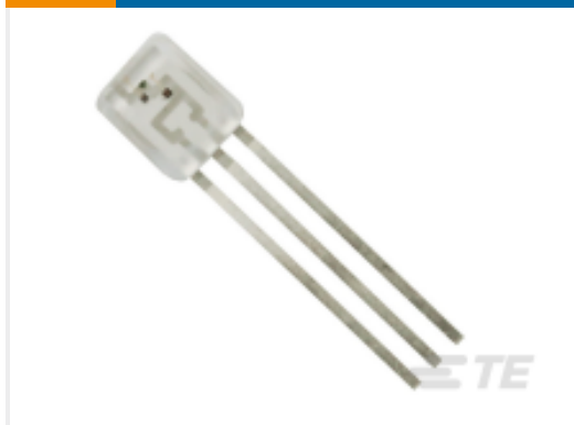
TE 产品编号11032254-00 EMITTER 660/940NM 1 2