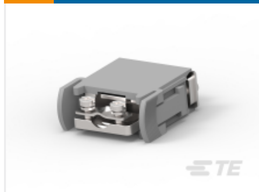
TE 产品编号T2111092201-007 HMN-009-F