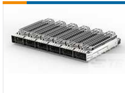
TE 产品编号2-2170708-1 CAGE ASSY, 1X6, QSFP28, SPRING, HS, LP