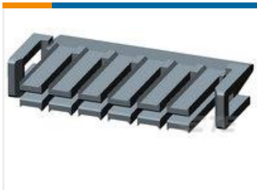
TE 产品编号2-1969541-8 RETAINER, TPA, DUAL ROW, EP2.5