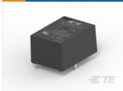
TE 产品编号1558662-4 T9GV2L14-15