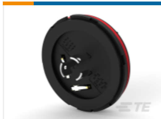
TE 产品编号1-2336396-1 ASSEMBLY, LIGHT CONTROLLER BASE, W/VENT