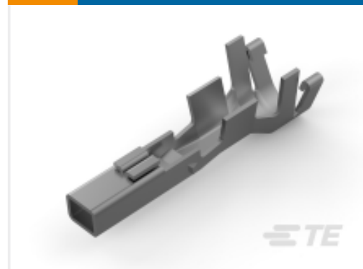
TE 产品编号177915-9 POWER DBL LOCK REC CONT