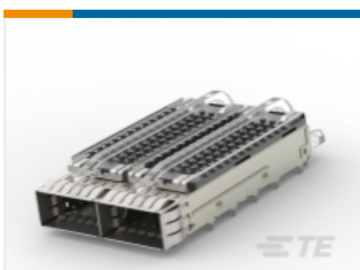
TE 产品编号2170808-1 QSFP28, 1X2, CAGE ASSY, SPRING, HS, LP