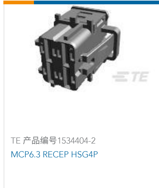
TE 产品编号1534404-2 MCP6.3 RECEPT HSG4P