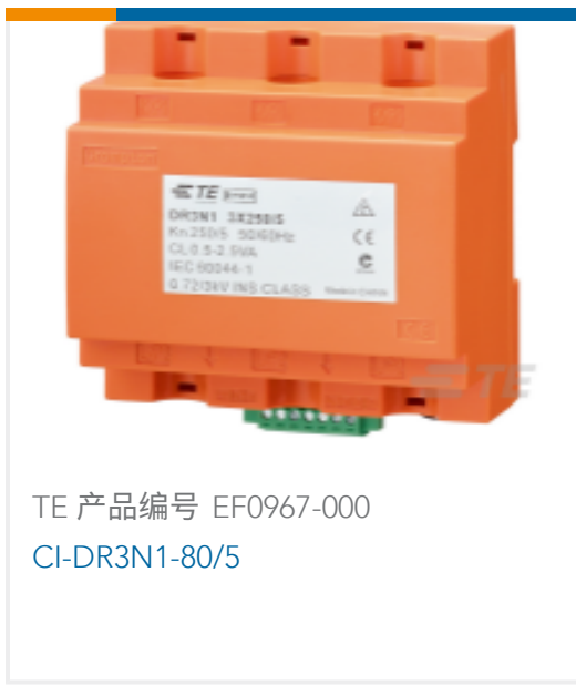
TE 产品编号 EF0967-000 CI-DR3N1-80/5