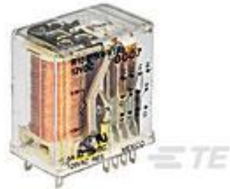
TE 产品编号 1393766-7 R10-E1X2-V28=R10