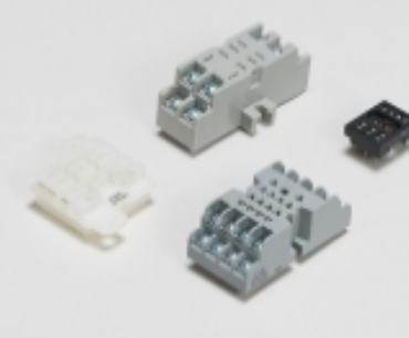
继电器附件、插座和卡箍(34)