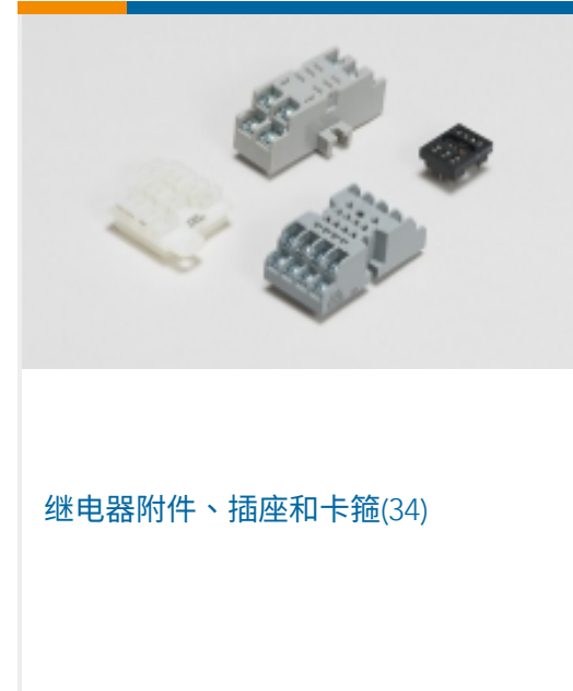
继电器附件、插座和卡箍(34)