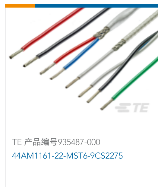
TE 产品编号935487-000 44AM1161-22-MST6-9CS2275