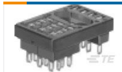
TE 产品编号 1393143-9 27E126=SOCKET,R10,16,SLG,PHE