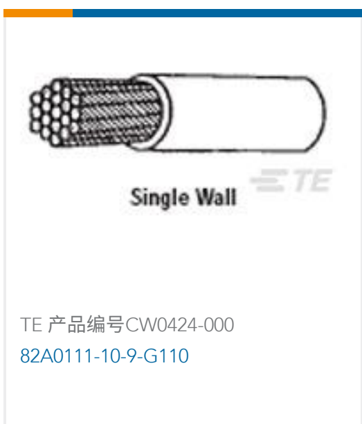
TE 产品编号CW0424-000 82A0111-10-9-G110