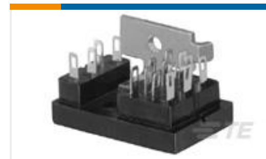
TE 产品编号 1-1393143-5 27E152=SOCKET,R10,ASSY,W/BRK