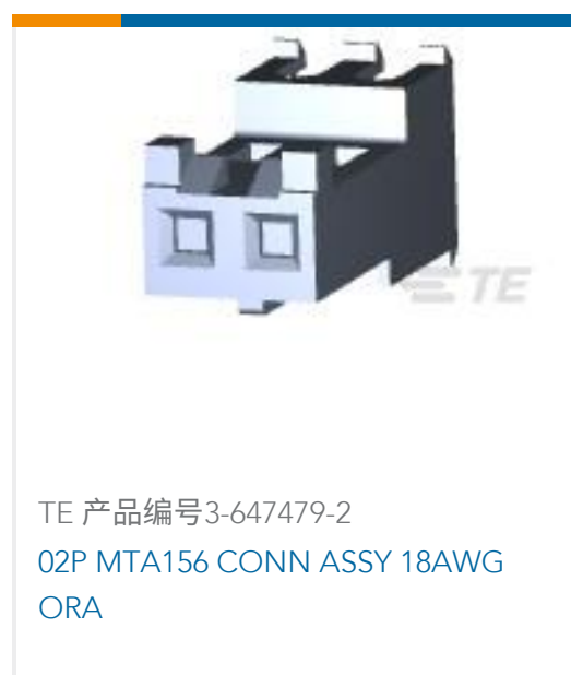
TE 产品编号3-647479-2 02P MTA156 CONN ASSY 18AWG ORA