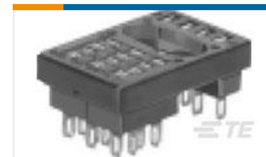
TE 产品编号 5-1393143-1 27E637=SOCKETS