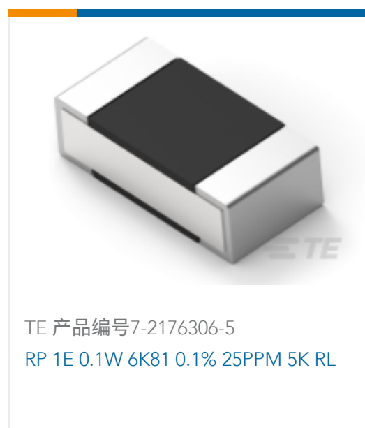
TE 产品编号7-2176306-5 RP 1E 0.1W 6K81 0.1% 25PPM 5K RL