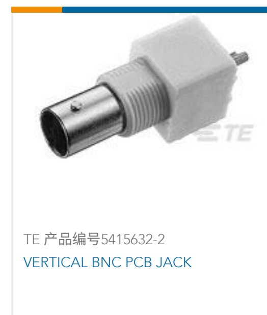
TE 产品编号5415632-2 VERTICAL BNC PCB JACK