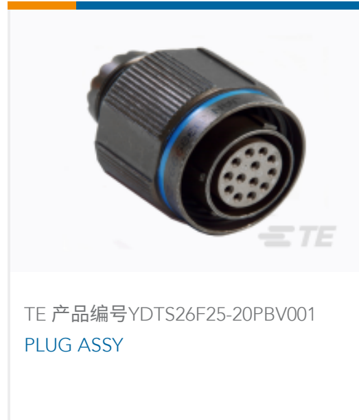
TE 产品编号YDTS26F25-20PBV001 PLUG ASSY