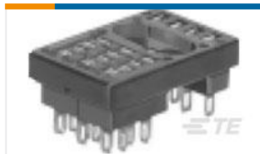
TE 产品编号 1-1393143-2 27E129=SOCKET,R10,16,PC,PHEN