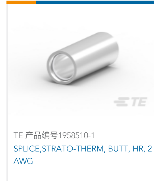
TE 产品编号1958510-1 SPLICE,STRATO-THERM, BUTT, HR, 2 AWG