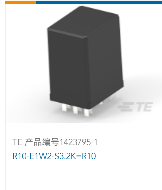
TE 产品编号1423795-1 R10-E1W2-S3.2K=R10