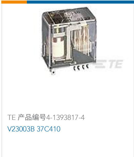
TE 产品编号4-1393817-4 V23003B 37C410