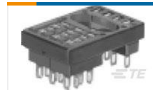
TE 产品编号 2-1393143-2 27E194=SOCKET,R10,16,PC,PHEN