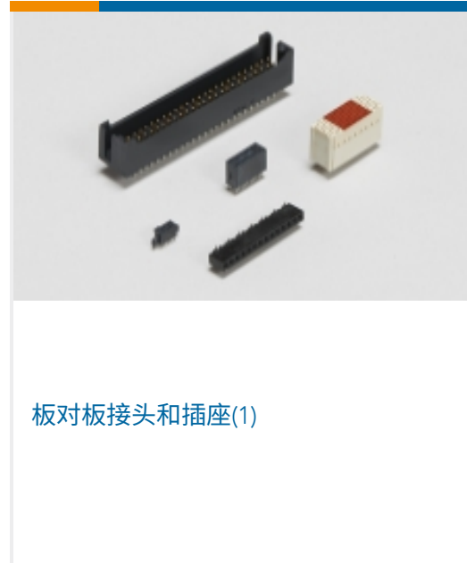
板对板接头和插座(1)