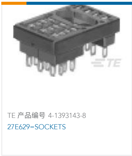
TE 产品编号 4-1393143-8 27E629=SOCKETS