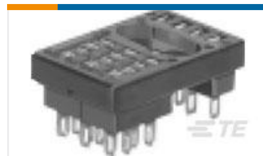
TE 产品编号 4-1393143-2 27E447=SOCKETS