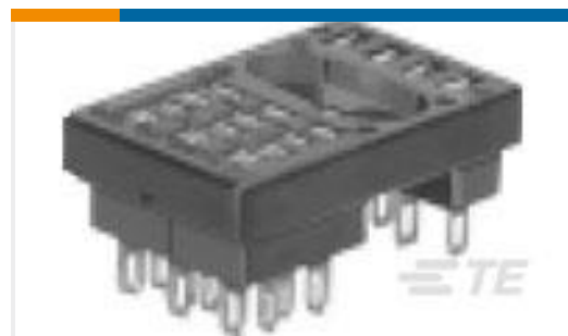
TE 产品编号 2-1393143-5 27E213=SOCKET,R10,16,PC,PHEN