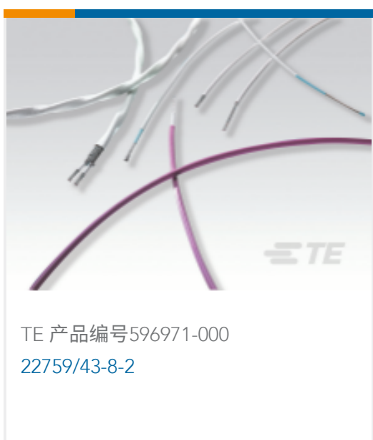
TE 产品编号596971-000 22759/43-8-2